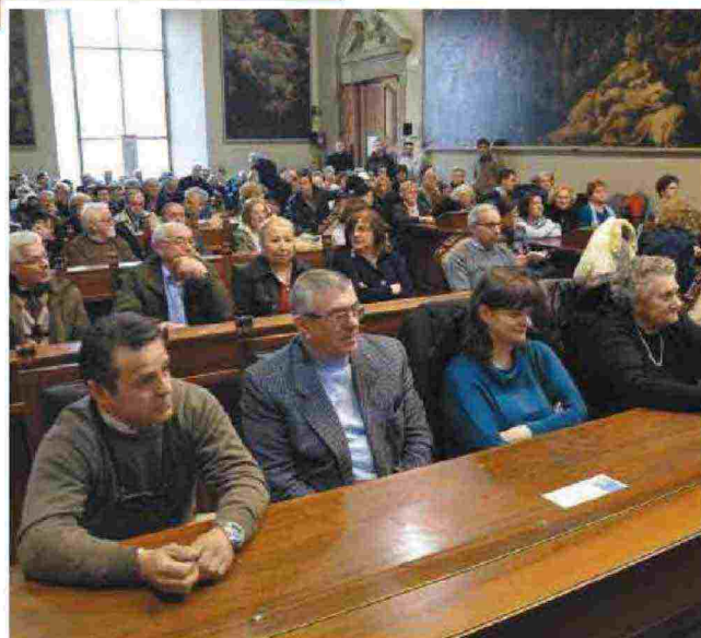
Il pubblico che ha affollato il salone dei Quadri

Nel testo di questo evangelista, Gesù non compie azioni, ma 'precede': questo significa che c'è chi lo segue, le donne riallacciano la sequela